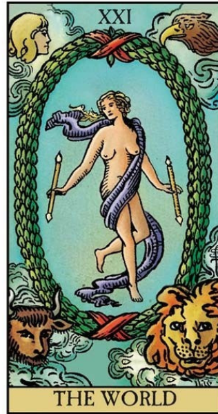
Arcano 21 O Mundo ou O Universo